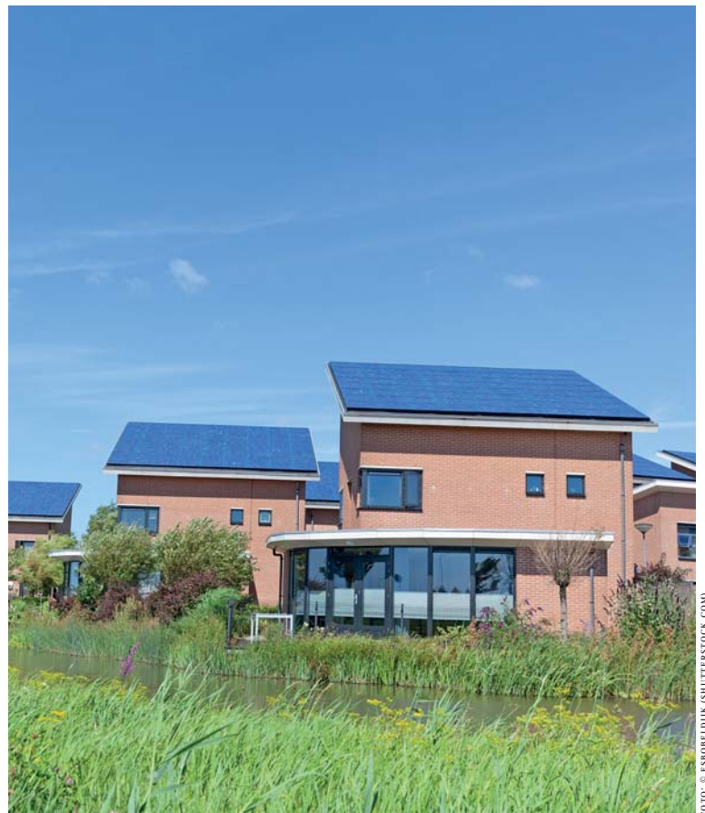
Erneuerbare Erzeuger geben zunehmend den Ton im Verteilnetz an.

Das WeSense™-Messsystem besteht aus einem intelligenten USB-Ladeadapter, einem handelsüblichen Smartphone und einer dort ausgeführten Smartphone-App. Wird der Lader in die Steckdose eingesteckt,